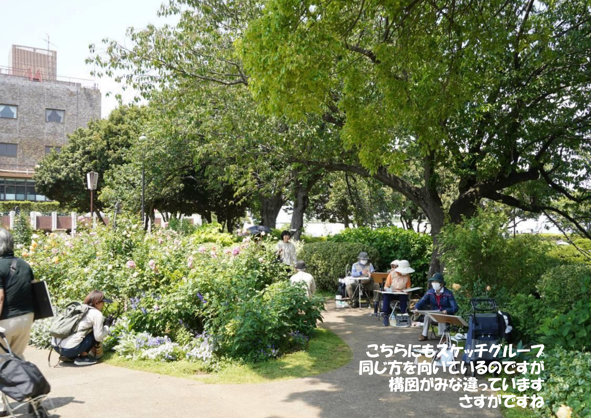
こちらにもスケッチグループ。同じ方を向いているのですが構図がみな違っていますね