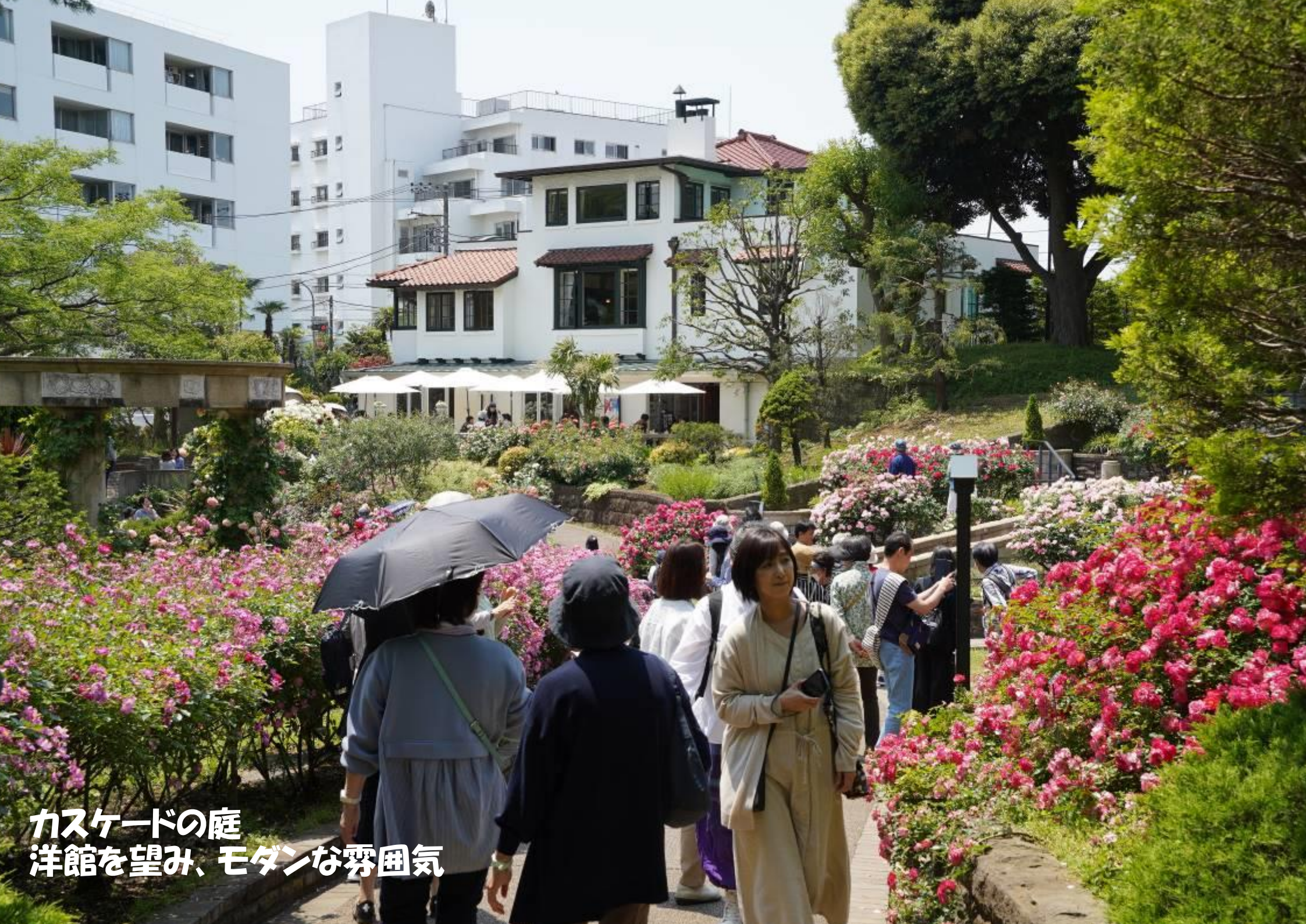
カスケードの庭 洋館を望み、モダンな雰囲気