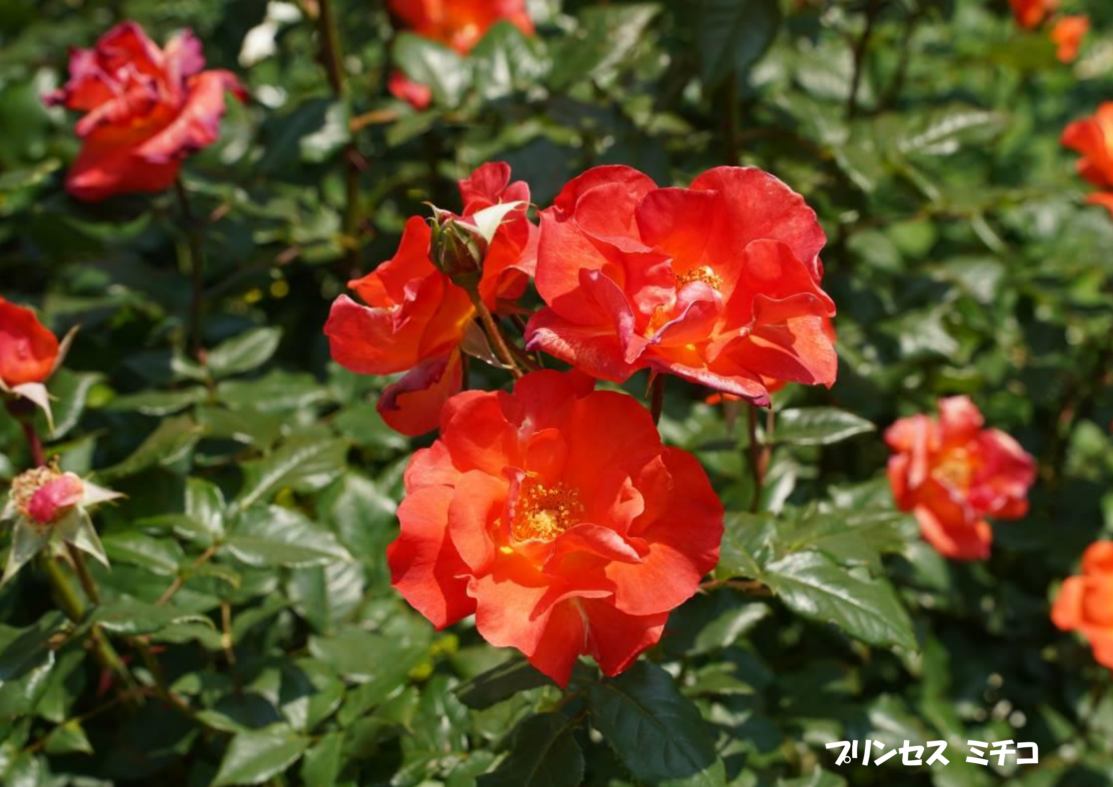
プリンセス ミチコ