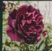
フランス デュブリュイ