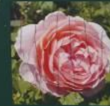
フランスス ブレイズ