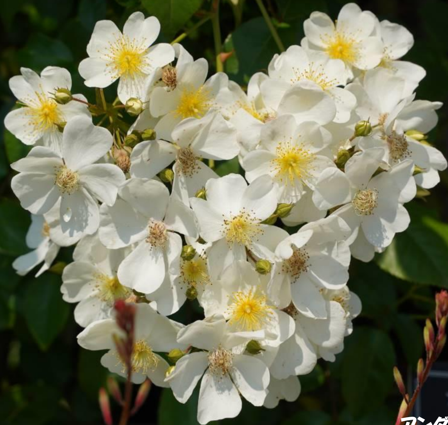
アンダーザローズ