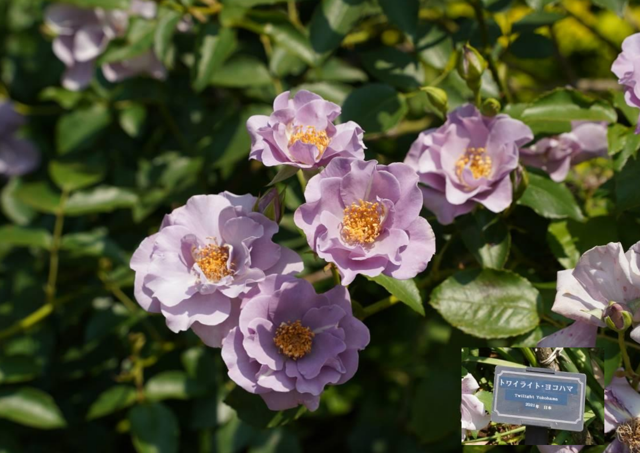
トワイライト・ヨコハマ Twilight Yokohama 2021年 日本