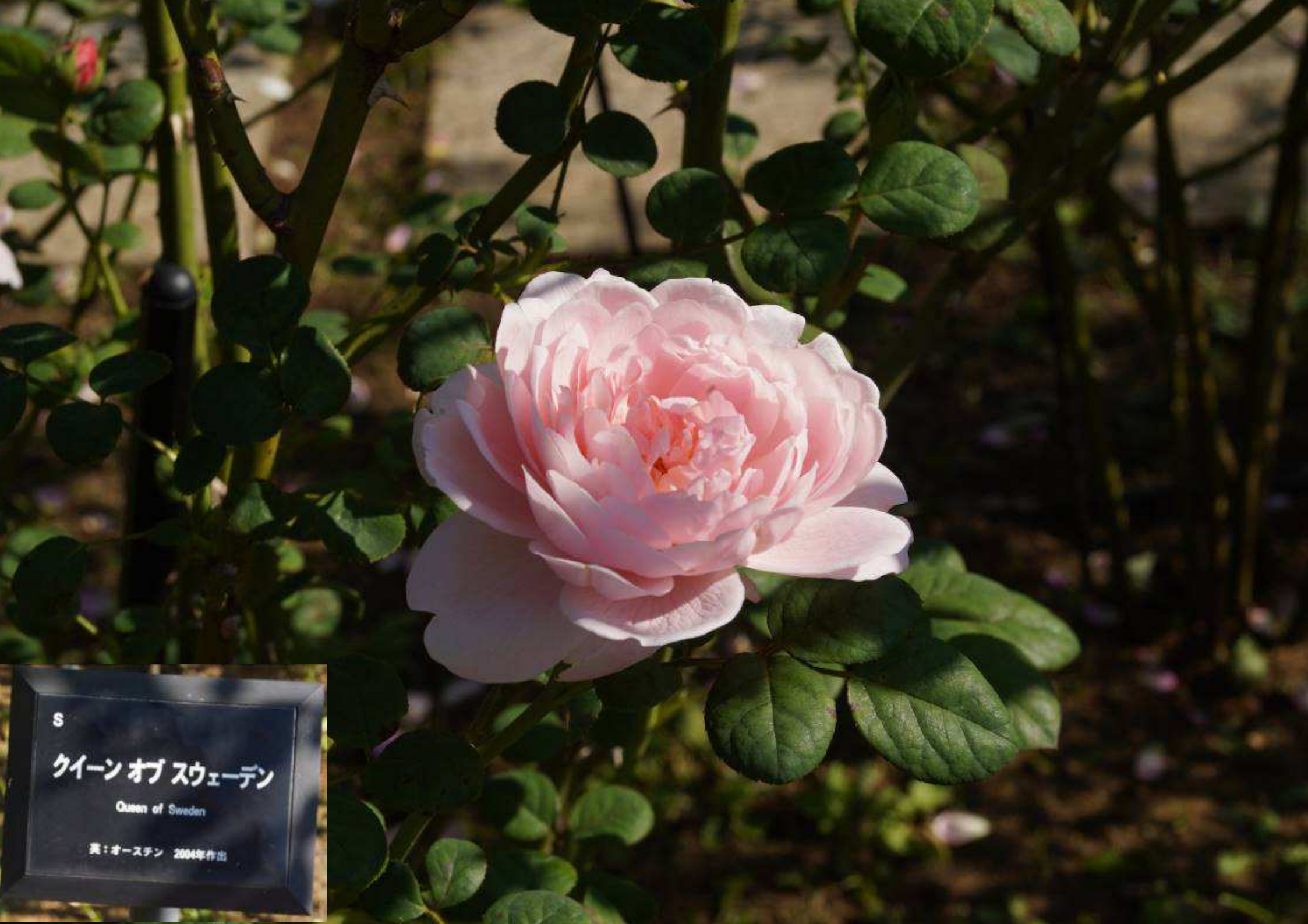
S クイーン オブ スウェーデン Queen of Sweden 英：オーステン 2004年作出