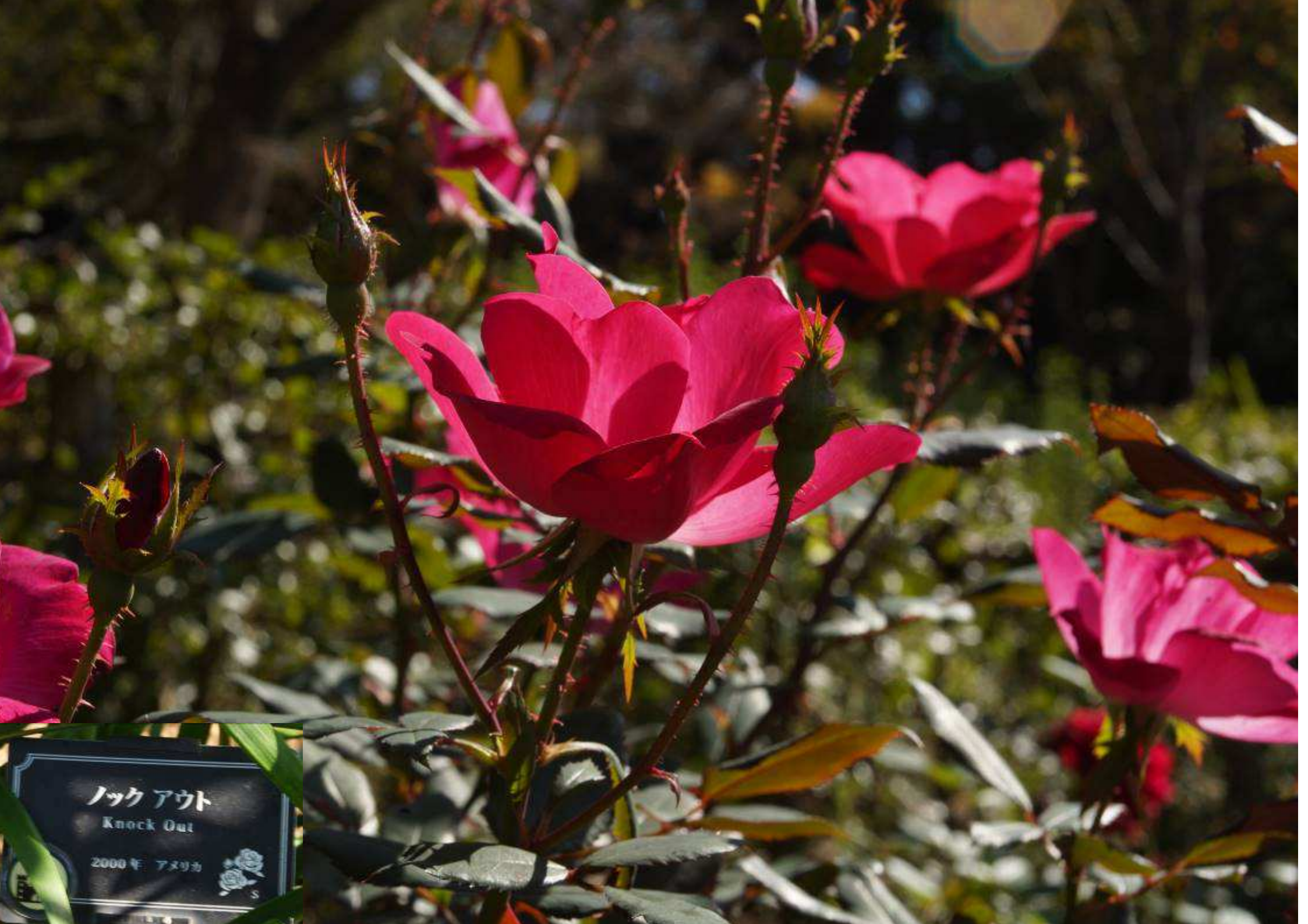
ノックアウト Knock Out 2000年 アメリカ