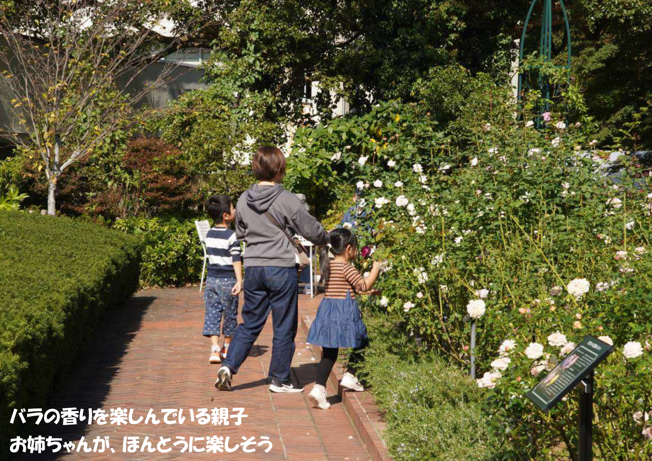
バラの香を楽しんでいる親子 お姉ちゃんが、ほんとうに楽しそう