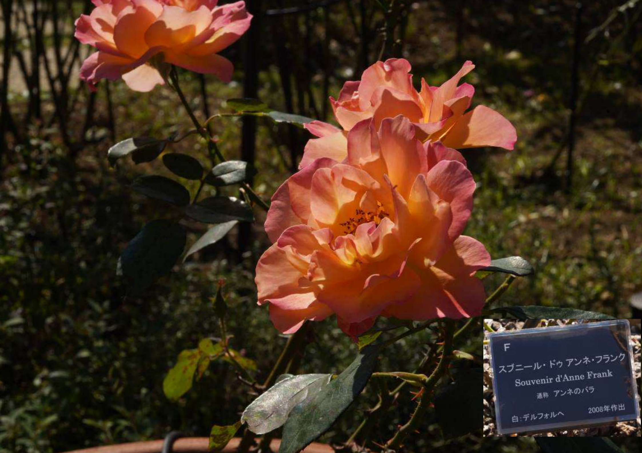
F スブニール・ドゥ アンネ・フランク Souvenir d'Anne Frank 通称 アンネのバラ 白:デルフォルヘ 2008年作出