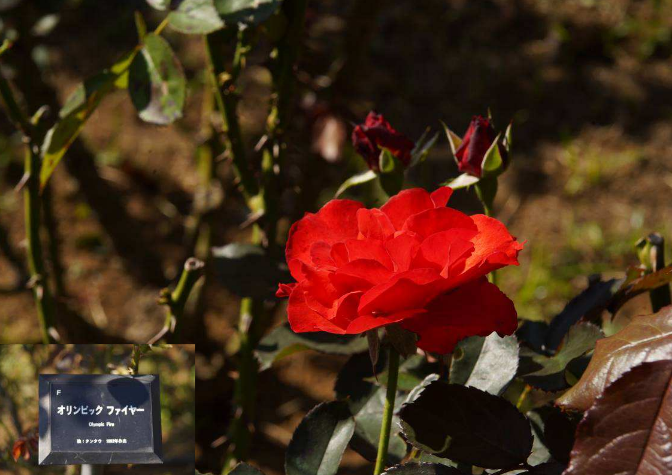
F オリンピック ファイヤー Olympic Fire 種：タンクワ 1982年作出