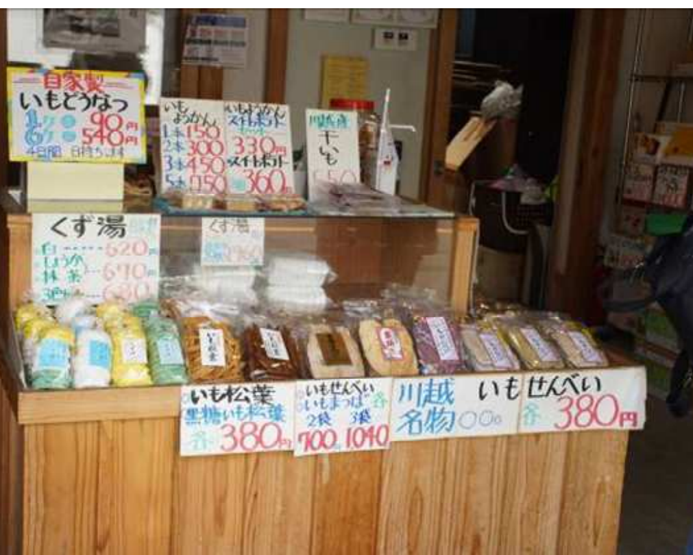
流石に、イモを使ったお菓子が目につく 棒麩も名物とか 撮影禁止が目に入らぬか