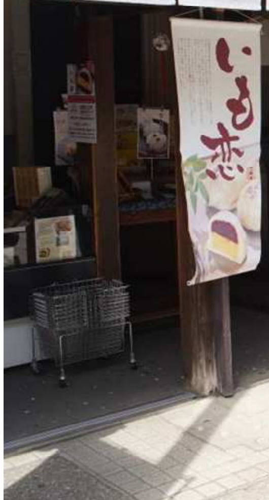
この道沿いにも、 おいしそうなお店がいっぱい 「いも恋」、お土産にと思ったけれど、すでにバッグはいっぱい