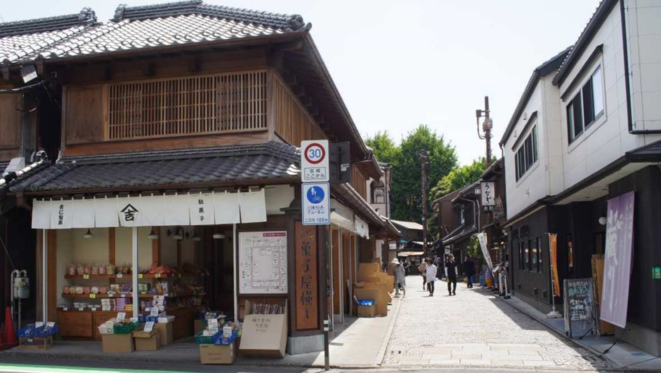
かの有名なお菓子屋横丁 突き当りが左に曲がっていて…