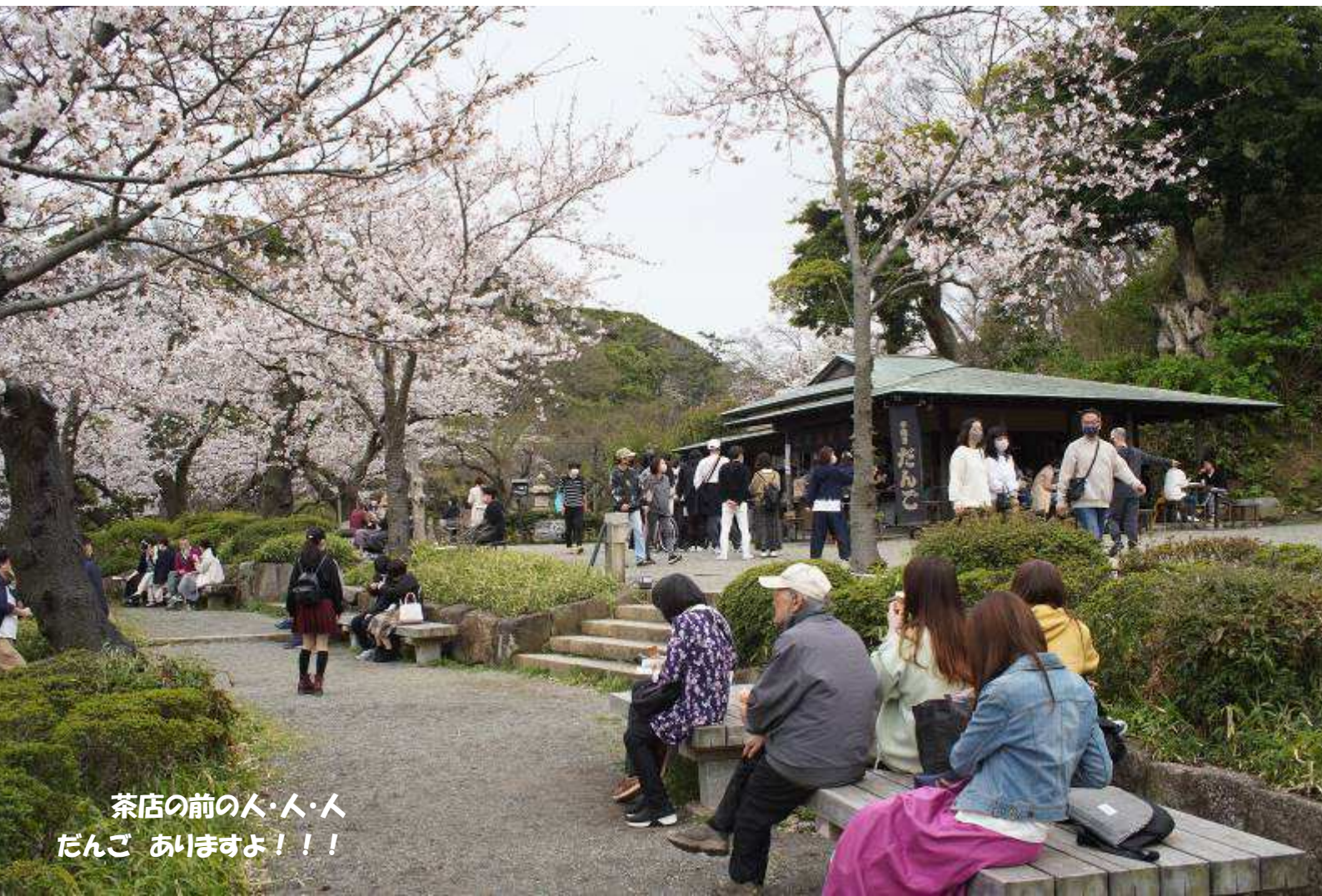
茶店の前の人・人・人 だんご あいませよ!!!