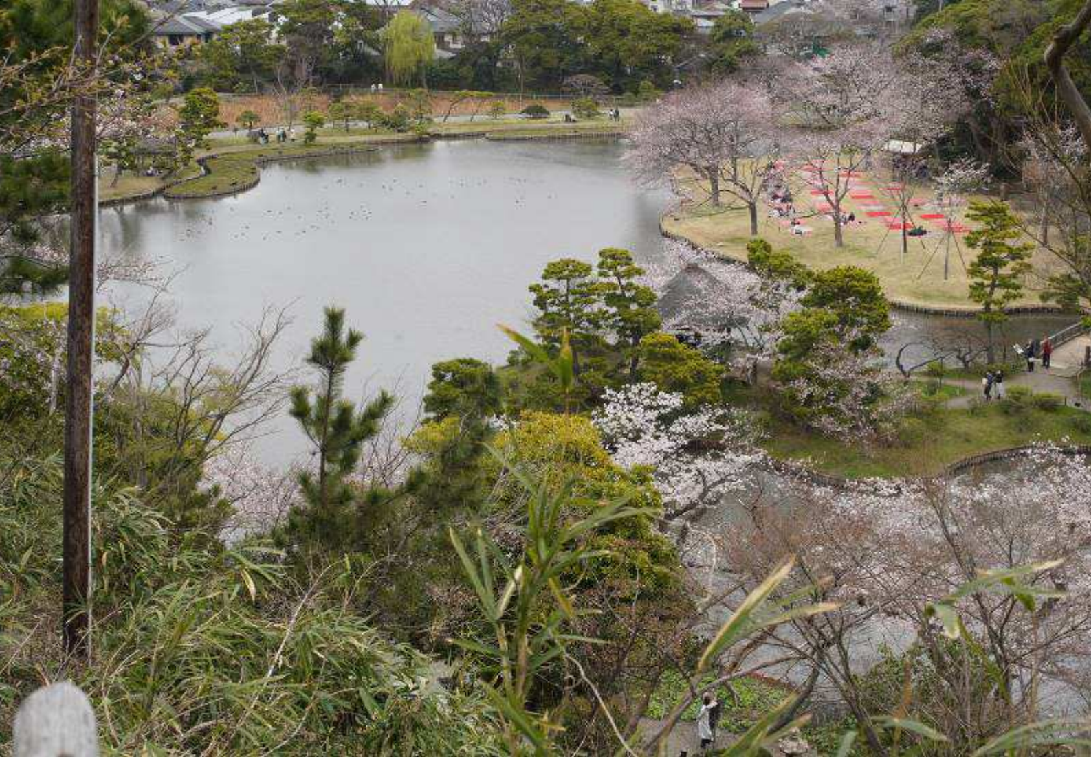
大池の周りの景色(上) 旧燈明寺本堂(下)が下ろせた