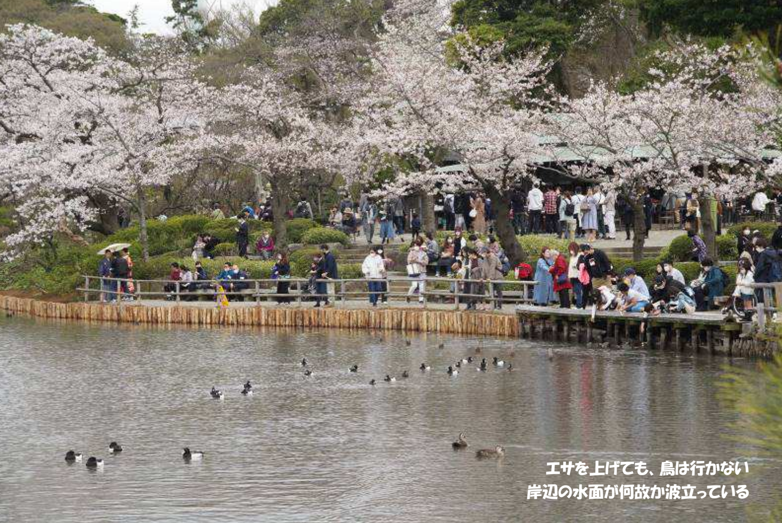
エサを上げてても、鳥は行かない 岸辺の水面が何故か波立っている