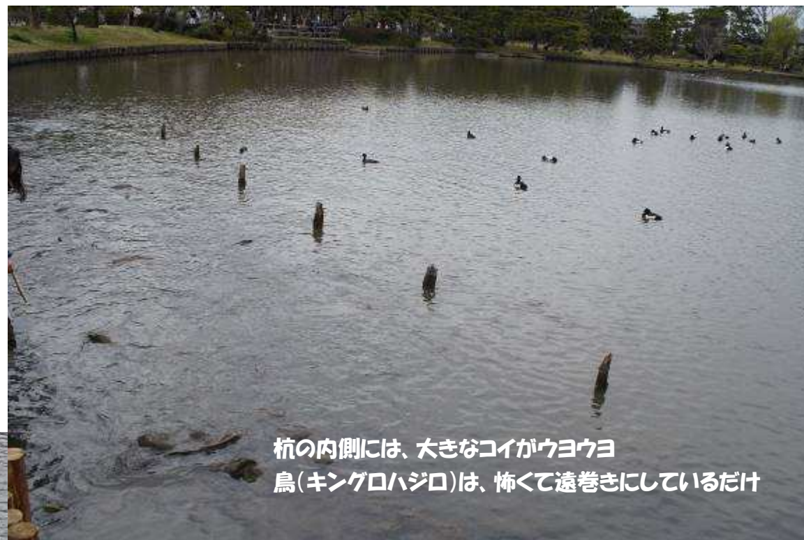
杭の内側には、大きなコイがウヨウヨ 鳥(キングロハジロ)は、怖くて遠巻きにしているだけ