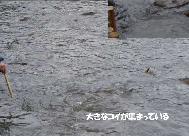
大きなコイが集まっている