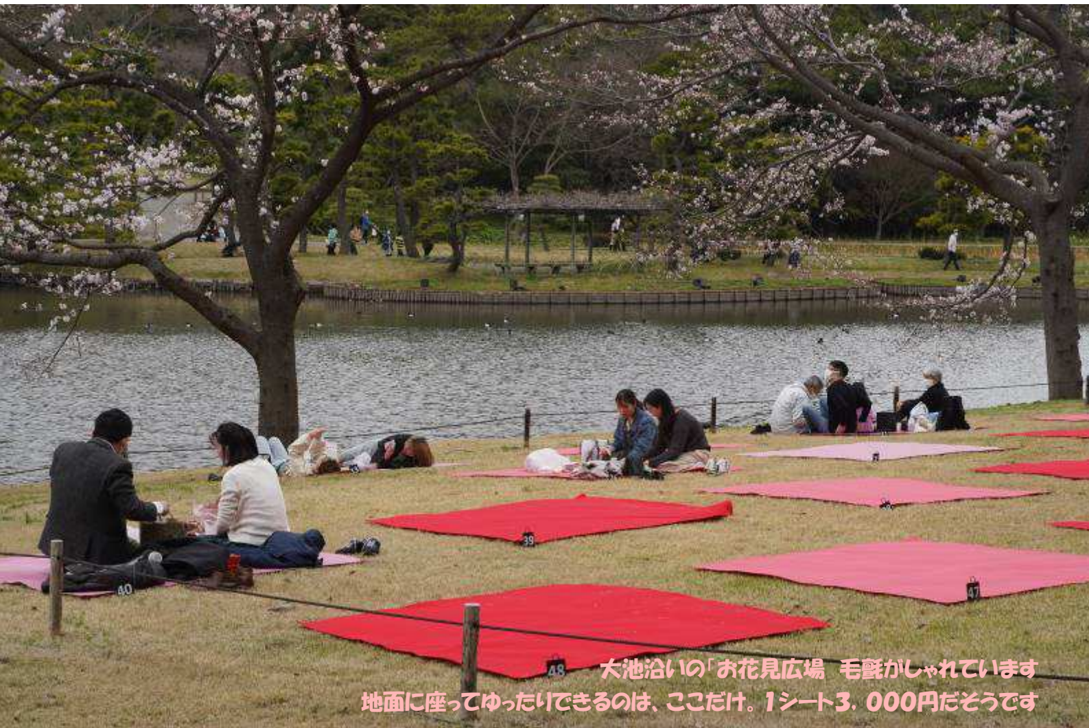
48 大池沿いの「お花見広場」毛氈がしゃれています 地面に座ってゆったりできるのは、ここだけ。1シート3,000円だそうです