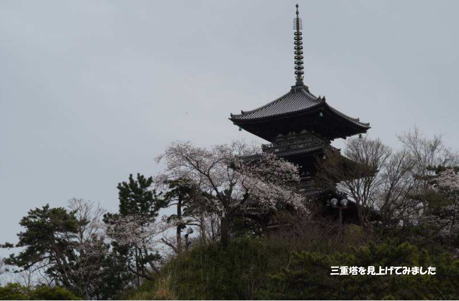
三重塔を見上げてみました