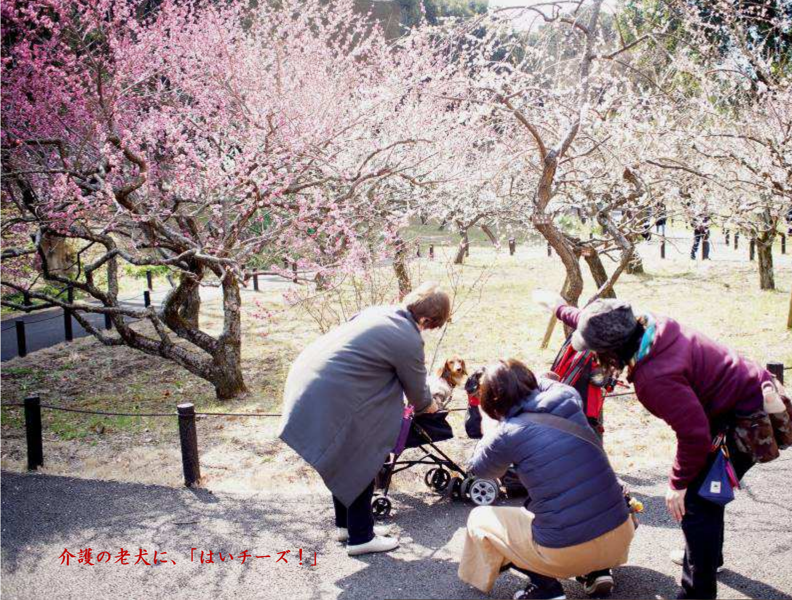
介護の老犬に、「はいチーズ！」