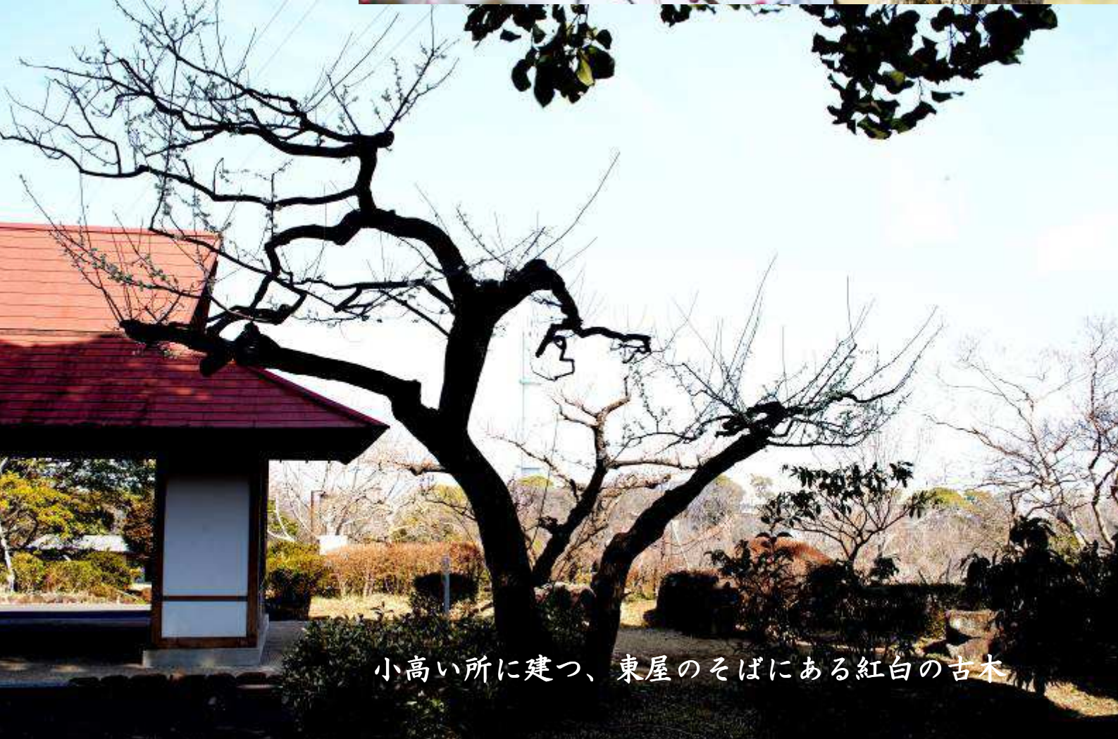
小高い所に建つ、東屋のそばにある紅白の古木