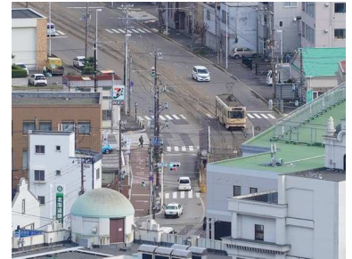
2合目(海拔140m)から函館港を望む。真正面の三森山が気になる。 路面電車が見えた