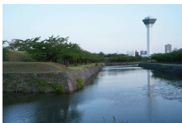
夕暮れの五稜郭タワー