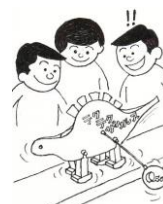
7月 テクテクザウルス