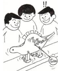
9月 テクテクザウルス