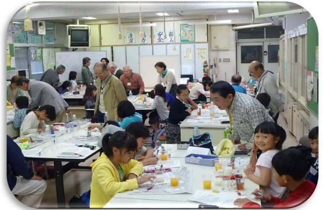
(「鉛筆充電機」の科学体験塾会場風景)