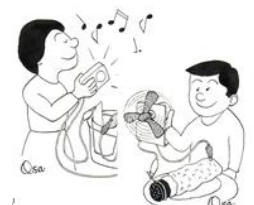
レモンや食塩水で電池を作ろう