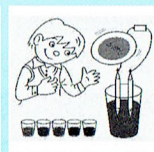
水と色のファンタジー