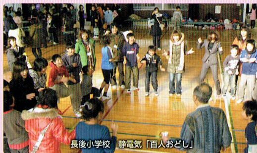
長後小学校 静電気「百人おどし」

小学校の課外授業等への協力や地域イベントへの参加など地域との連携に努めています。