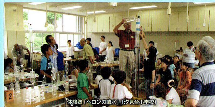
体験塾「ヘロンの噴水」(夕見台小学校)