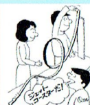
ジェットコースター