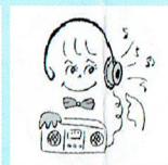
紙コップヘッドフォン