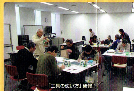
「工具の使い方」研修